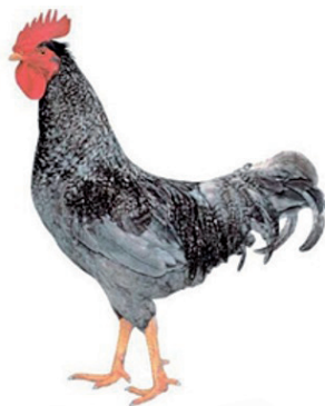
Galo da raça Cendrey