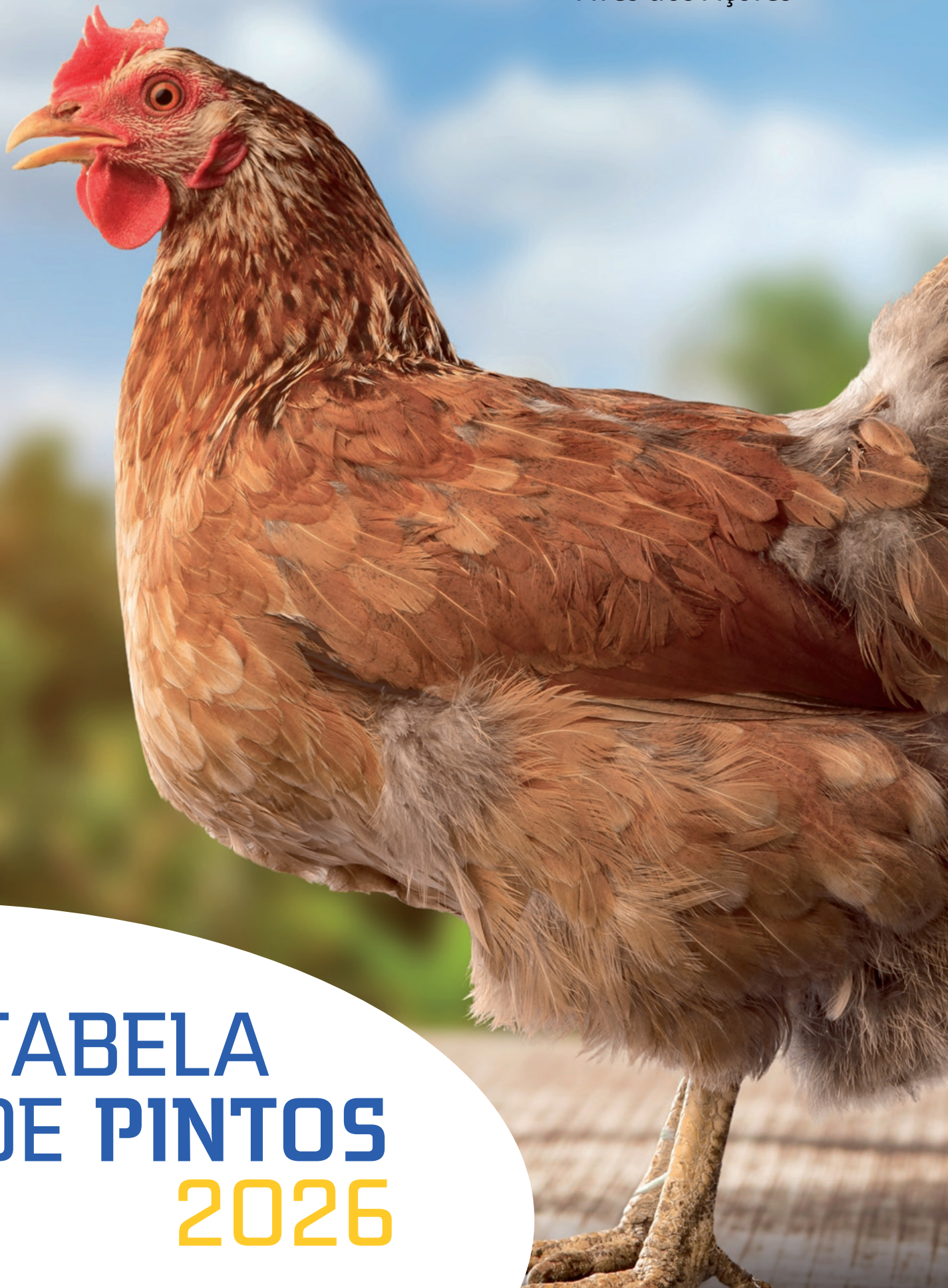
TABELA DE PINTOS 2026