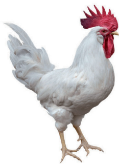
Galo Branca DEKALB WHITE ( Legorne )