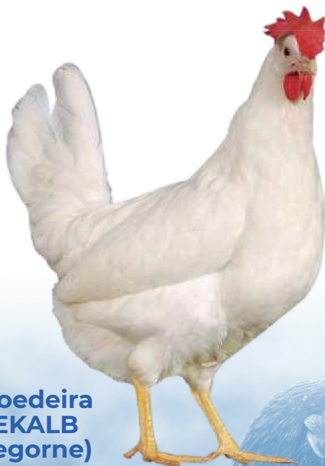
Galinha Poedeira Branca DEKALB WHITE (Legorne)