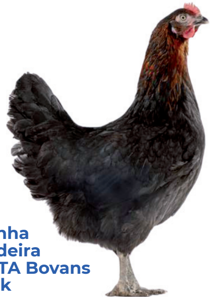
Galinha Poedeira PRETA Bovans Black