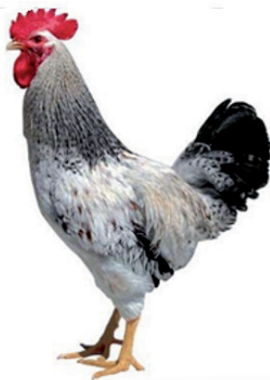
Galo sussex (Ivory)