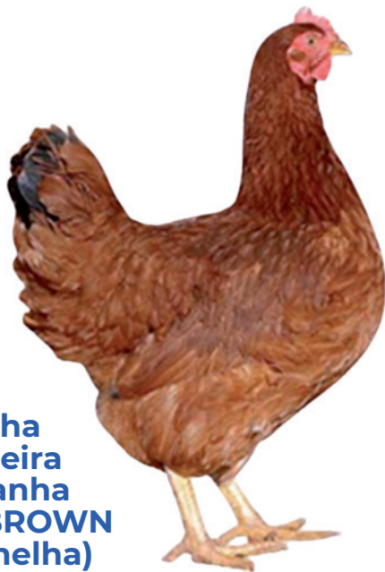
Galinha Poedeira Castanha ISA BROWN (vermelha)